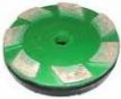
MS0 (kit de 3 pièces)