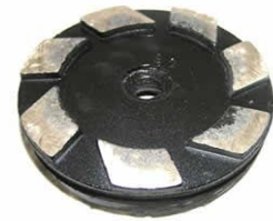
MS2 (kit de 3 pièces)

Disques diamantés métalliques Ø 100mm pour le ponçage du marbre à utiliser avec la LEVIGHETOR 600/640 : MS0 -MS1 -MS2