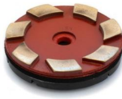
MS1 (kit de 3 pièces)