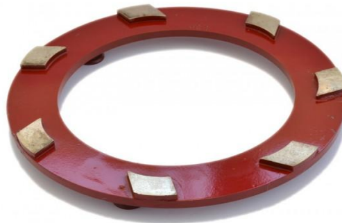
MS1 Ø 200mm (kit de 3 pièces)

Disques diamantés métalliques Ø 100mm pour le ponçage du marbre à utiliser avec la LEVIGHETOR 600/640 : MS0 -MS1 -MS2